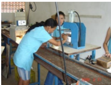
Detentos em horário de trabalho no Presídio de Tijucas