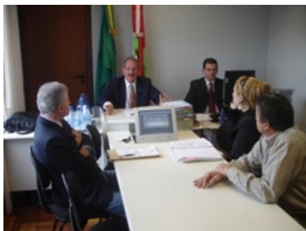
Sessão de conciliação em Tubarão, em novembro de 2008

O magistrado adiantou que, para 2010, novas sessões itinerantes serão realizadas no interior do Estado.