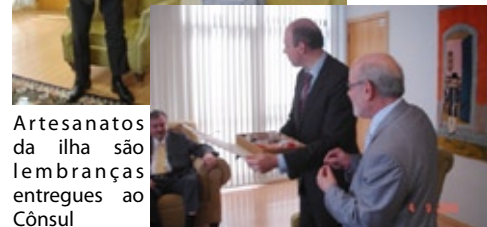
Artesanatos da ilha são lembranças entregues ao Cônsul