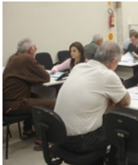
Meta 2 pretende julgar processos que ingressaram até 31 de dezembro de 2005