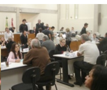
Mutirão do Executivo Fiscal da Comarca de São José, em junho, realizou 90% de acordos