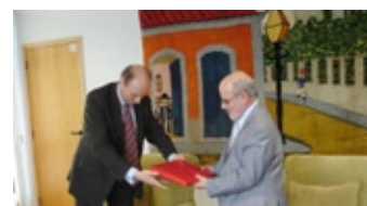
Corregedor-geral da Justiça recebe livro do Cônsul da Bélgica

Bélgica, país europeu, caracteriza-se por ser uma Monarquia Constitucional Parlamentar. Possui uma área de 32.545 Km 2 e tem, aproximadamente, 10 milhões de habitantes. Sua capital é Bruxelas.