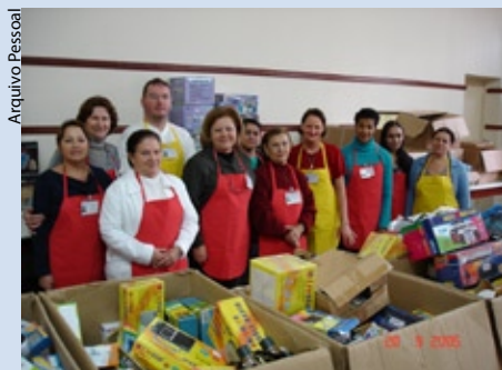
Equipe de voluntários da Associação Ação Social e Cultural da Catedral

Em 2004 a pedido do padre Francisco Wloch, responsável pela Catedral Metropolitana de Florianópolis, começou a ajudar na restauração de uma das partes da igreja que havia desmoronado.