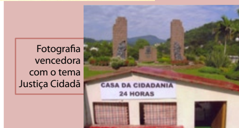
Fotografia vencedora com o tema Justiça Cidadã