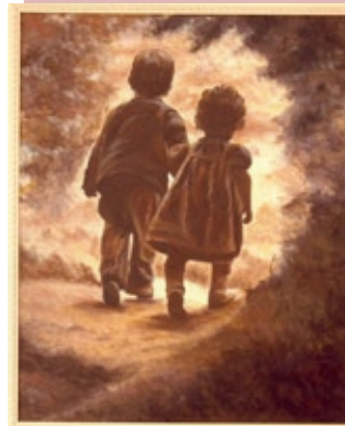
Obra Pequenos Passos, Grandes Momentos, 1ª colocada na categoria pintura

Na primeira edição, em 2008, foram 47 colaboradores inscritos nas quatro categorias. Eis os trabalhos premiados: